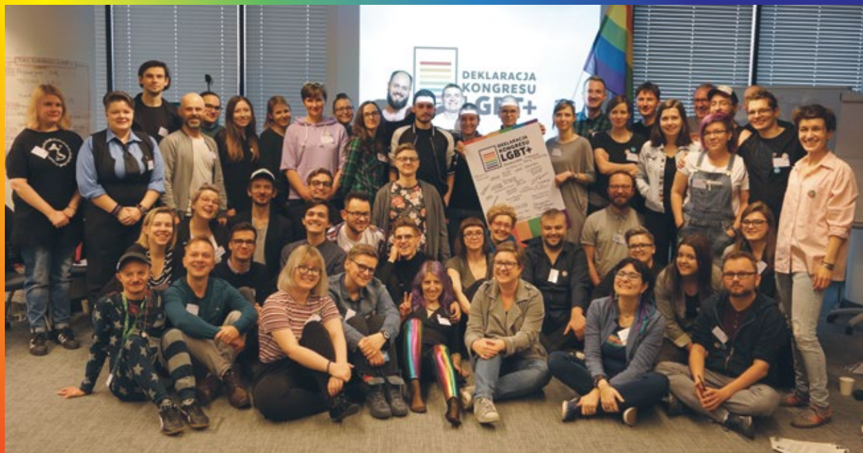
Ludzie z 27 organizacji z całej Polski na Kongresie LGBT+, 30 marca 2019